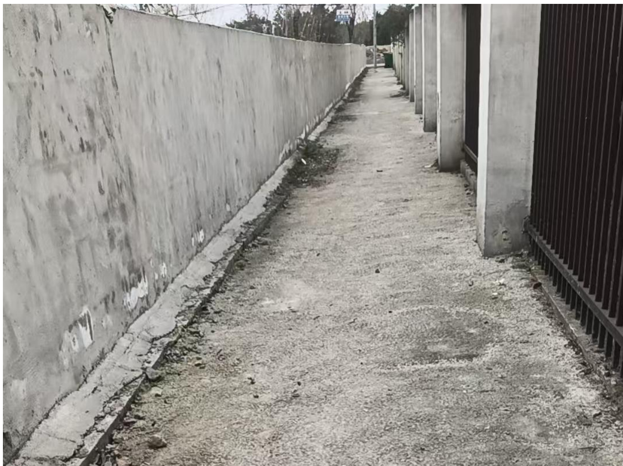
现场相片 4（围墙外散水沟）