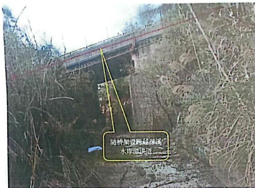
图 2 深溪水库大坝溢洪道

由于地形因素限制，管道走向变动较为困难，且管道内输送介质为自来水（水质符合《生活饮用水卫生标准》GB5749-2006），不会污染周围环境。据悉，该大坝溢洪道上方桥梁由仪陇净化厂修建，后将资产移交给仪陇县立山镇政府，本工程供水管道拟随该溢洪道上方桥梁架设而过，在此特向仪陇县立山镇政府说明，同意与否，盼以回复。