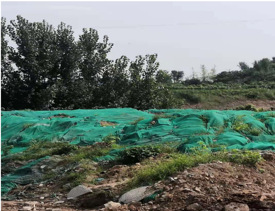
综合利用方堆放点现状

经土石方平衡后，项目综合利用方为 1.54 万 m^3 ，均为一般土石方，综合利用方目前临时堆放在临近羽毛球建设区域的道路工程区内，用做后期羽毛球运动场项目建设回填土，现场踏勘堆土已采取覆盖与绿化措施，具有一定水土保持工程。但从水土保持角度来看，堆放方量相对较大，需进一步设置排水与沉沙措施，以防止雨期水土流失加剧，本方案对此进行补充。