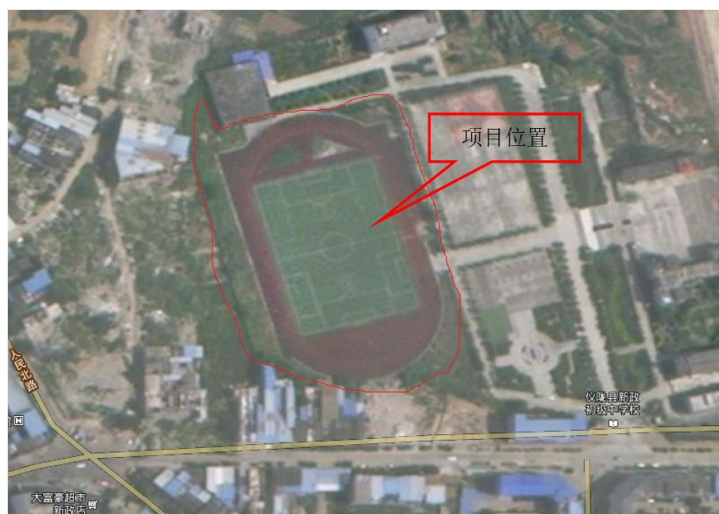
图 2.1-1 项目地理位置

本项目位于位于四川省南充市仪陇县琳琅大道北二段，地理坐标范围为：东经 106°18'26"~106°18'39"，北纬：31°17'4"~31°17'15"，地处仪陇县城区繁华地带，地理位置优越，交通极为便利。项目地理位置图如下图 2.1-1 所示。